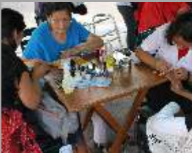
Campañas de Salud y Belleza

OTROS SERVICIOS: Almuerzos de confraternidad, celebración de cumpleaños, beneficios para ingreso a funciones teatrales, Peña Jesusmariana, Retretas Bailables, Clases de Baile al aire libre, y mucho más Te esperamos: Jr. Estados Unidos N° 291 Teléfono 261-8285