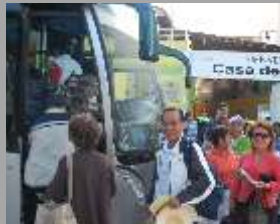
Visitas y Excursiones