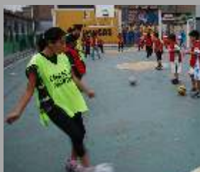
Futbol y voley