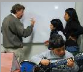
Música y canto

Otros servicios: clases de salsa, capoeira, marinera, manicure, computación, Corel Draw, matemática, lenguaje, ping pong, y mucho más Av. Horacio Urteaga cuadra 10. Teléfono 4234760